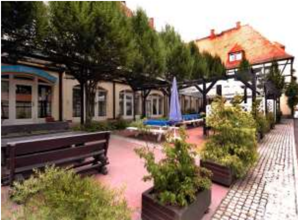
Biergarten an der Klause (ggü. Der Kegelbahn)

Wir Sachsen sind überzeugt, dass Sie sich auf Anrieb wohlfühlen und neben der Ausstellung noch Momente der Entspannung und Erholung finden.