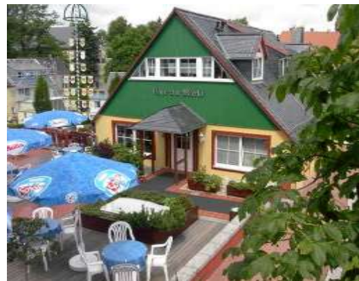
Café am Mark

Bitte parken Sie unbedingt auf dem hoteleigenen Parkplatz und Gemeindeparkplatz.